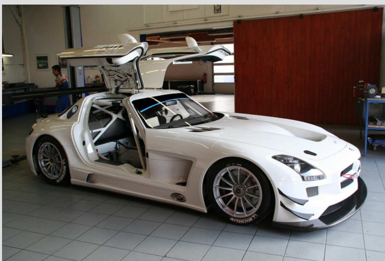
Livraison des deux Mercedes à Chinon au Graff Racing le 10 mars 2011

Mercedes SLS AMG GT3: « AMG est le constructeur de la voiture de route sous le contrôle de Mercedes-Benz ; c'est l'écurie allemande HWA qui développe pour AMG la version compétition. A ce jour, vingt voitures ont été construites et seul le Graff Racing dispose de deux modèles pour le GT Tour en France. L'entreprise s'appuie sur la tradition du « un homme, un moteur » signifiant que le mécanicien qui a assemblé un moteur appose sa griffe sur son travail et en assume ainsi l'entière responsabilité. Selon AMG « seule une fabrication à la main garantit un niveau de précision, de performances et de fiabilité absolue ».